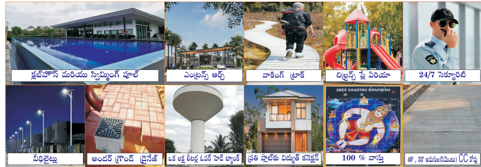
క్లబ్ హౌస్ మరియు స్విమ్మింగ్ పూల్