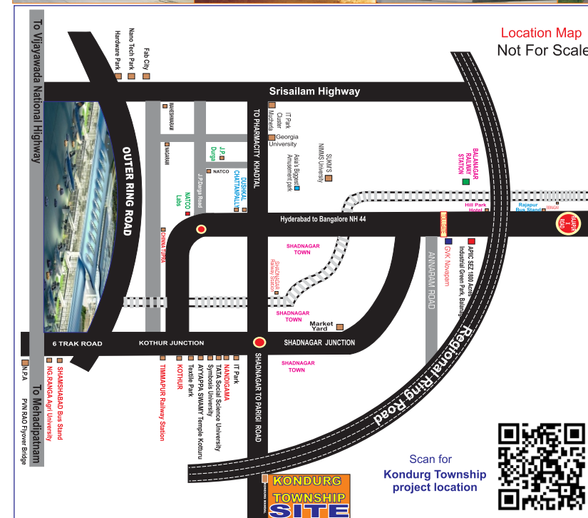
Location Map Not For Scale